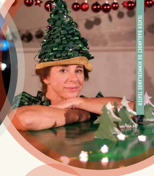
TEATER BAGLANDET OG HIMMERLANDS TEATER