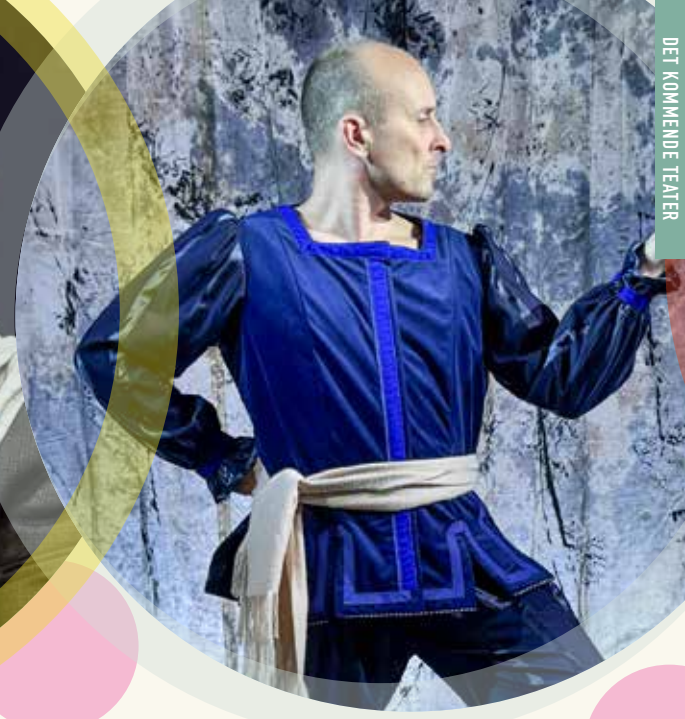
DET KOMMENDE TEATER