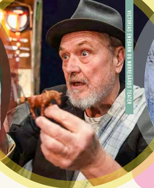
VICTORIAS ENEBARN OG NØRREGÅRDS TEATER